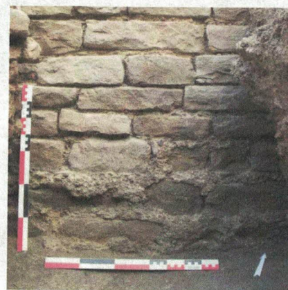
Figure 2 : détail du parement d'un mur rue des Veaux, à Strasbourg (M. Werlé, 2009)